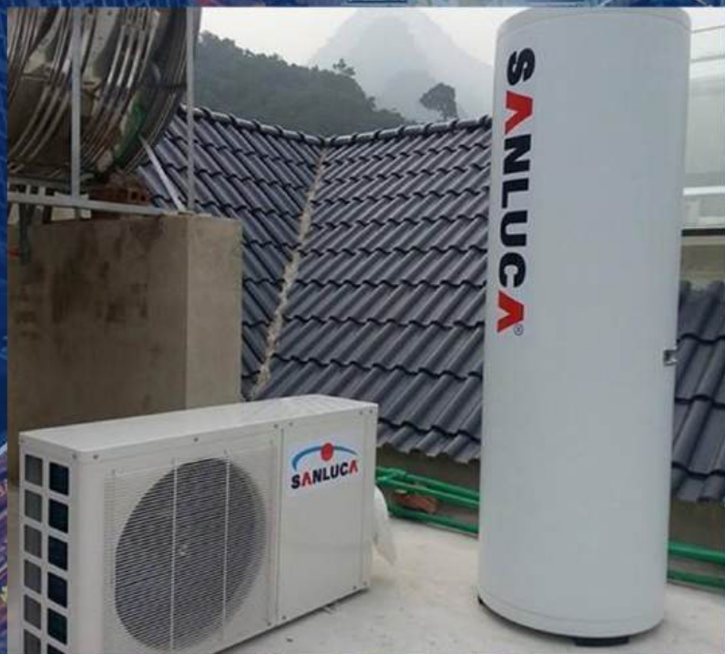
• Biệt thự Anh An