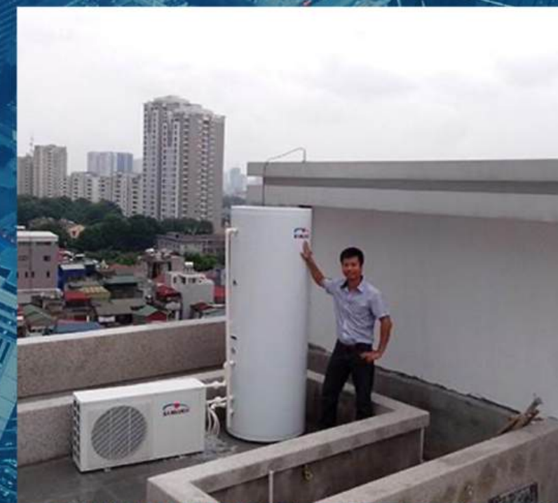
• Biệt thự Anh Công hồ 3 mẫu