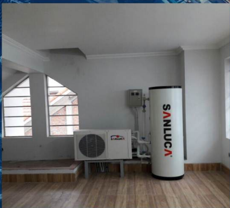
• Biệt thự, Khu đô thị An Hưng