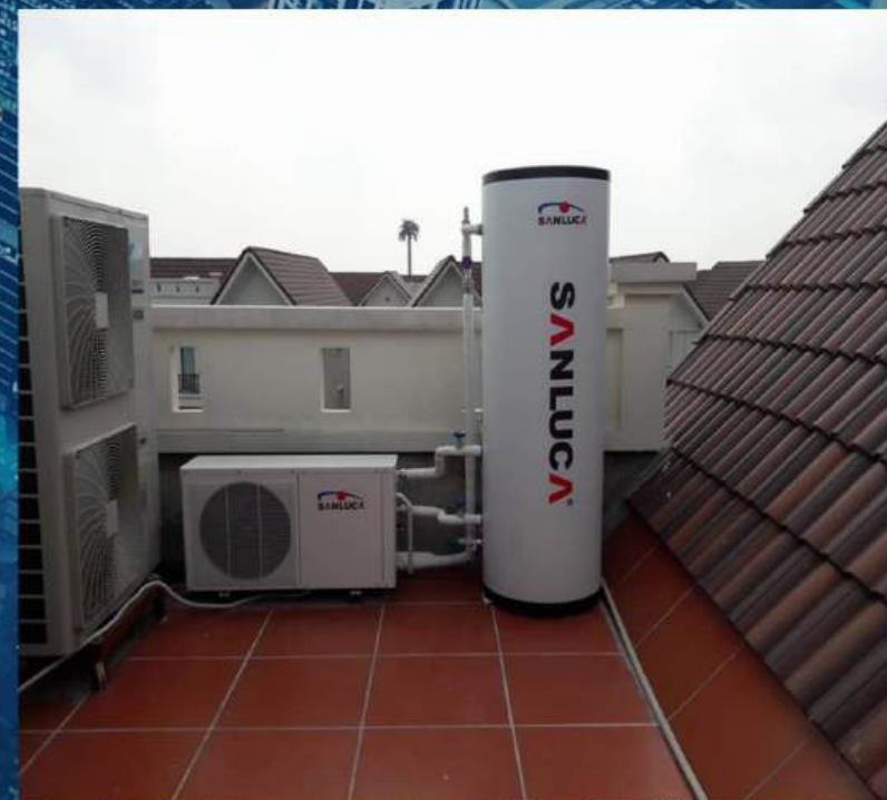
• Khu đô thị Vinhomes